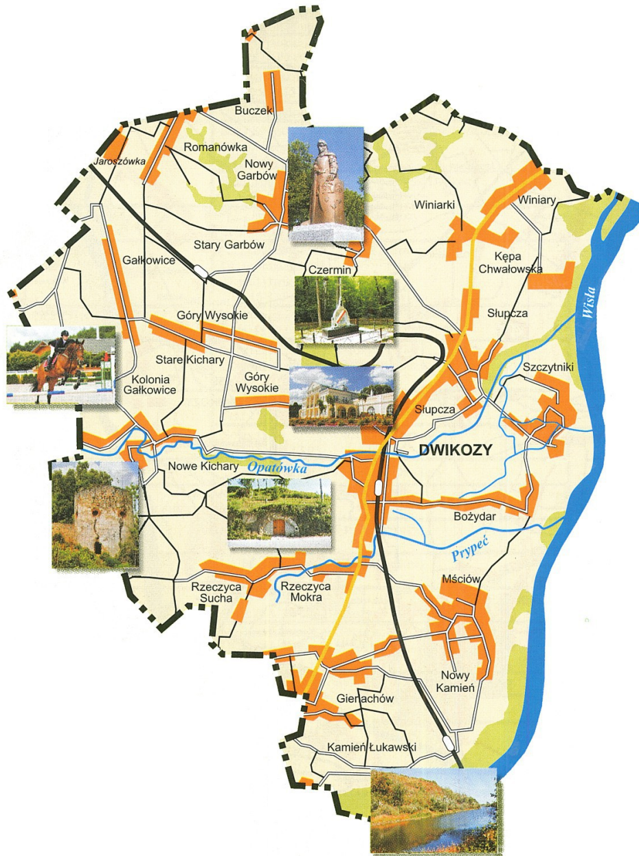
Mapa nr 1. Mapa Gminy Dwikozy