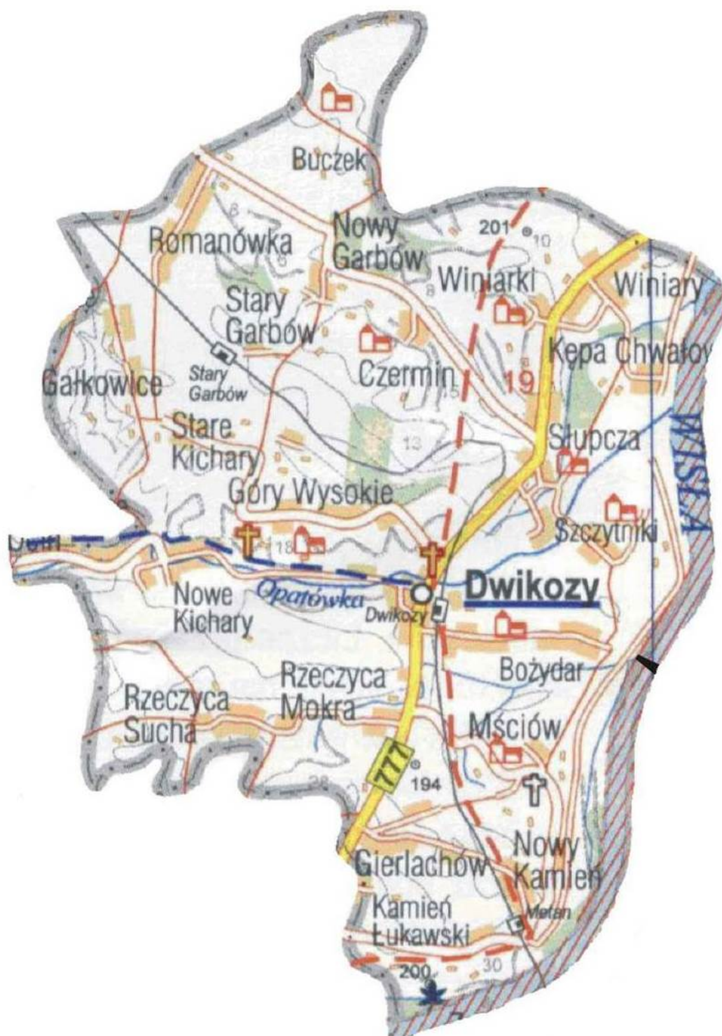
Mapa nr 1 Mapa Gminy Dwikozy

Lokalizacje poszczególnych miejscowości przedstawiono na poniższej mapie.